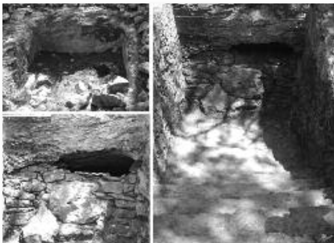
Εικ. 9. Τομέας I (Ανατολικός), τάφος 4/2007 από Δ προς Α.