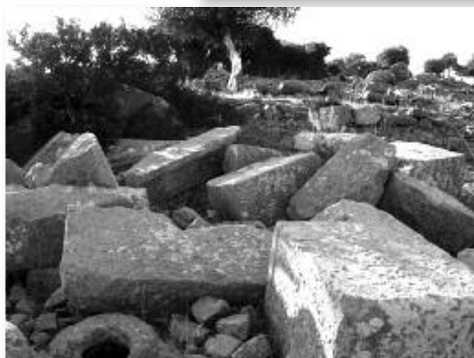
Εικ. 5. Μνημει- ακὲς κατα- σκευές στὰ Μαρμαρούνια.