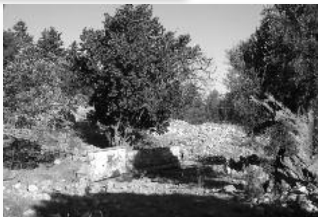
Εικ. 4. Η πηγή τῶν Στελιῶν σήμερα.