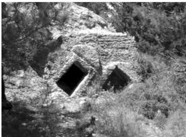
Εικ. 3. Αρχαιολογική θέση «Άλώνια», λαξευτός τάφος.