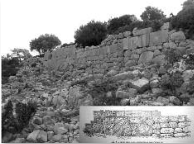
Εικ. 6. Τομέας ΙΙ (Ακρόπολη), όχυρωματικός περίβολος.