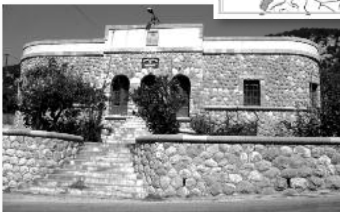
Εικ. 14. Κέντρο Αρχαιολογικής Έρευνας Κυμισάλας (ΚΑΕΚ) - πρώην Αστυνομικός Σταθμός Μονολίθου.