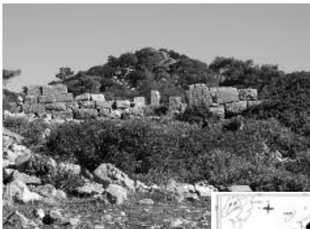
Εικ. 12 Αρχαιολογική θέση «Βασιλικά».