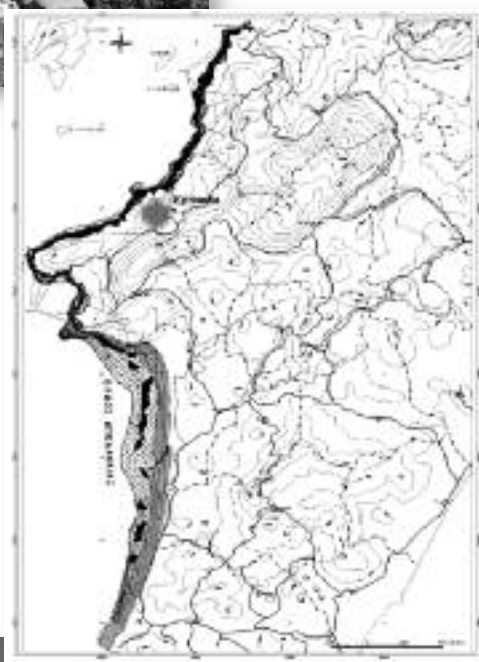
Εικ. 13. Η περιοχή του δικτύου Natura 2000, Άκραμίτης-Αρμενιστής-Ατάβυρος (κωδικός GR 4210005).