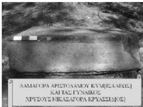
Εικ. 10. Τομέας IV (βόρειος). Ἐπιτύμβια ἐπιγραφή.