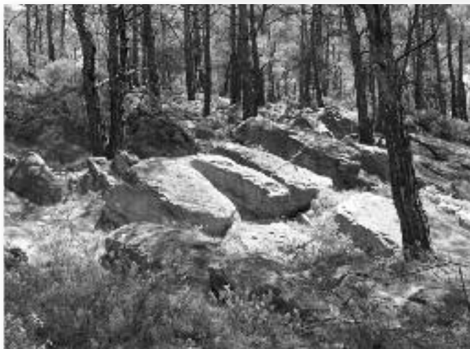
Εικ. 8. Άγ. Φωκάς, αρχαία λατομεία.