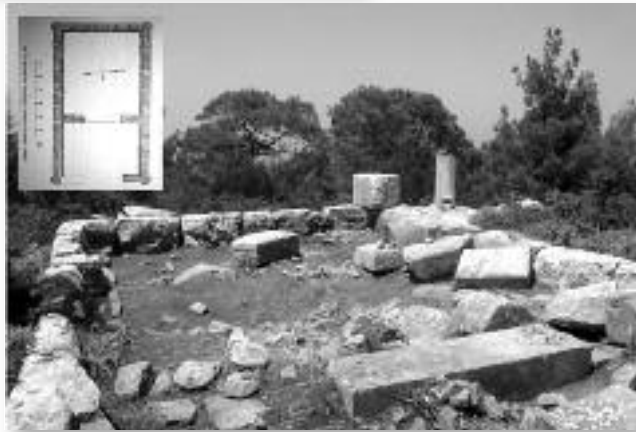
Εικ. 7. Τομέας ΙΙ (Ακρόπολη), Ναός από Α-Δ.